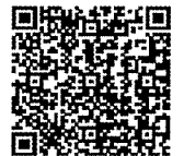
インボイス制度特設サイト