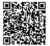
e-Taxを利用した確定申告書作成方法動画